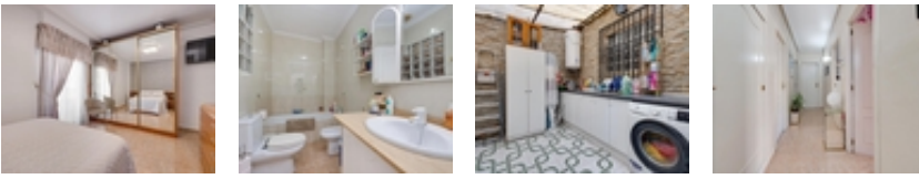
Amplia vivienda céntrica con solárium privado en Torrevieja