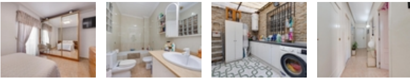
Amplia vivienda céntrica con solárium privado en Torrevieja